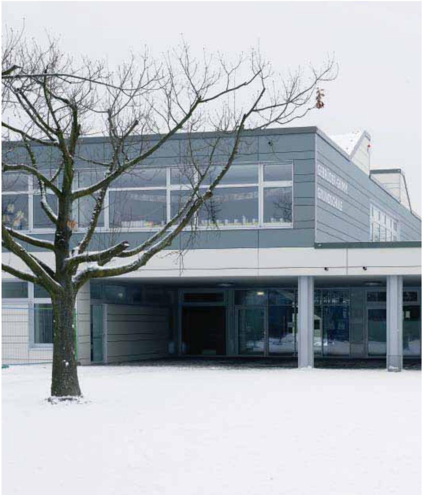
Gebrüder-Grimm-Schule, Neuss Architekten: BM+P Architekten, Düsseldorf Produkt: Eternit Natura PRO