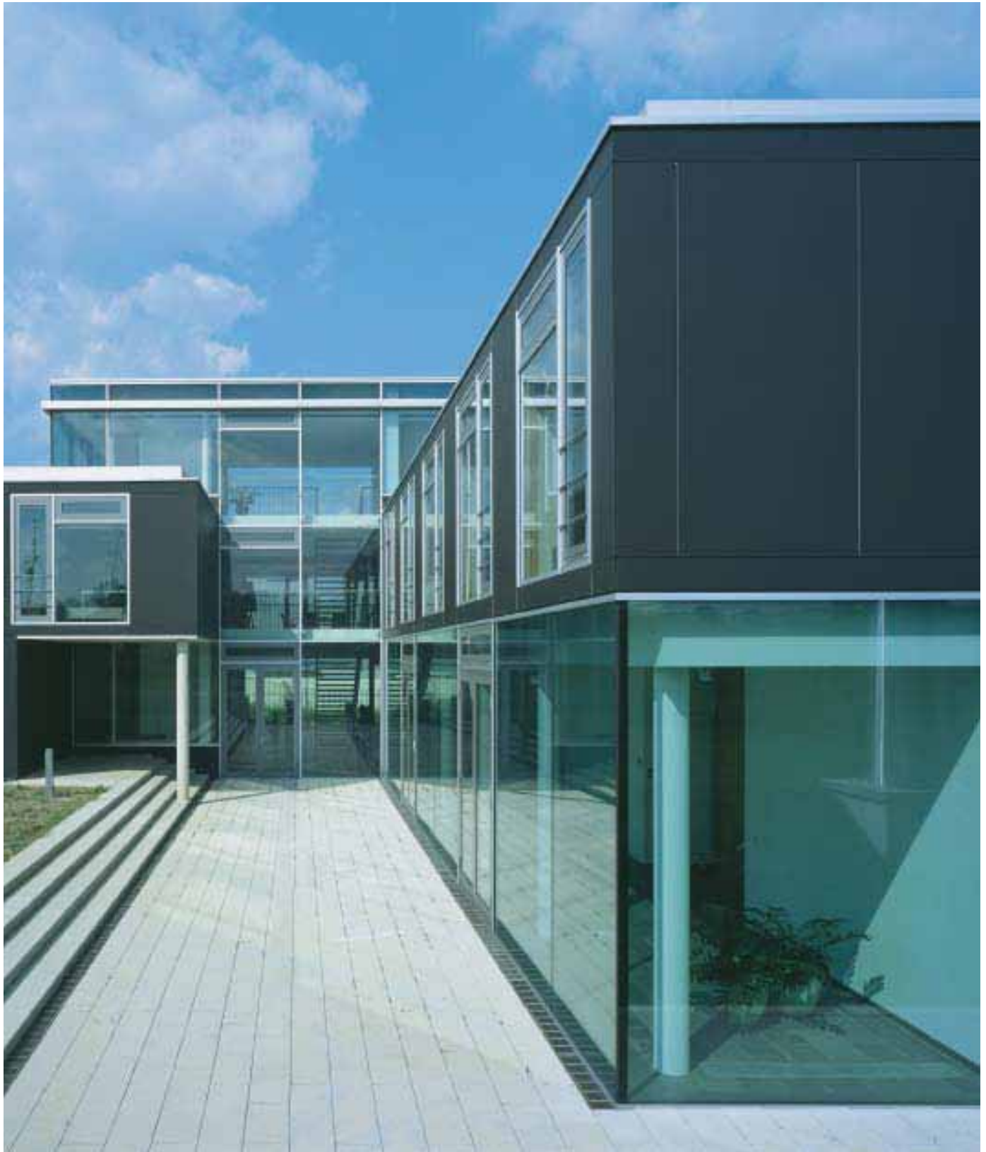
Bildungswerk der Sächsischen Wirtschaft, Dresden Deutscher Fassadenpreis für vorgehängte hinterlüftete Fassaden 2004 Architekten: Heinle, Wischer und Partner Produkt: Eternit Textura schwarz TA 001